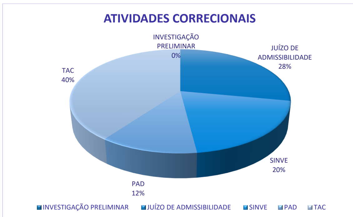
Figura 2 – Percentual de Processos Correcionais