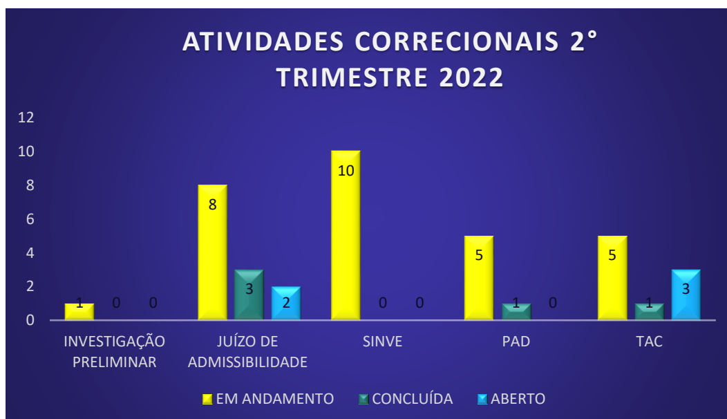
Figura 1 – Total de Processos Correccionais no 2º trimestre de 2022 – 1/04 a 30/06/22

Em atendimento ao previsto no artigo 5º, inciso VI, do Decreto n.º 5.480/2005, a Corregedoria do SGB deverá encaminhar trimestralmente à Corregedoria-Geral da União/CRG-CGU relatório de atividades dos procedimentos instaurados, concluídos e em andamento.