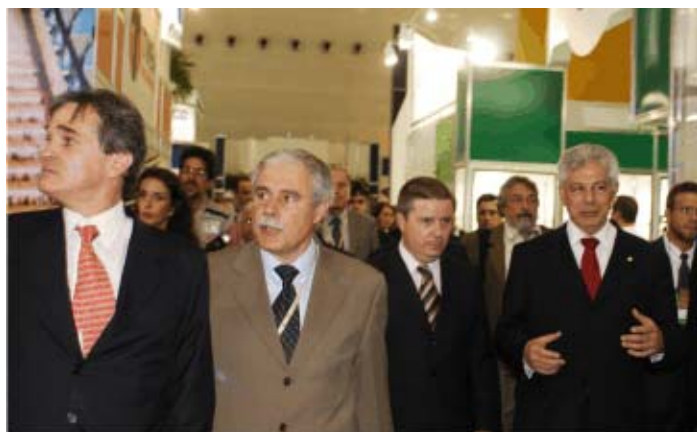
Autoridades percorrem a feira Exposibram