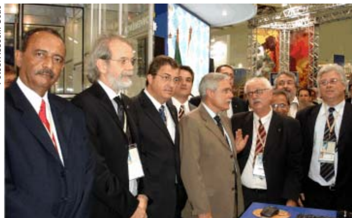
Ministro visita o estande MME/SGM/CPRM/DNPM