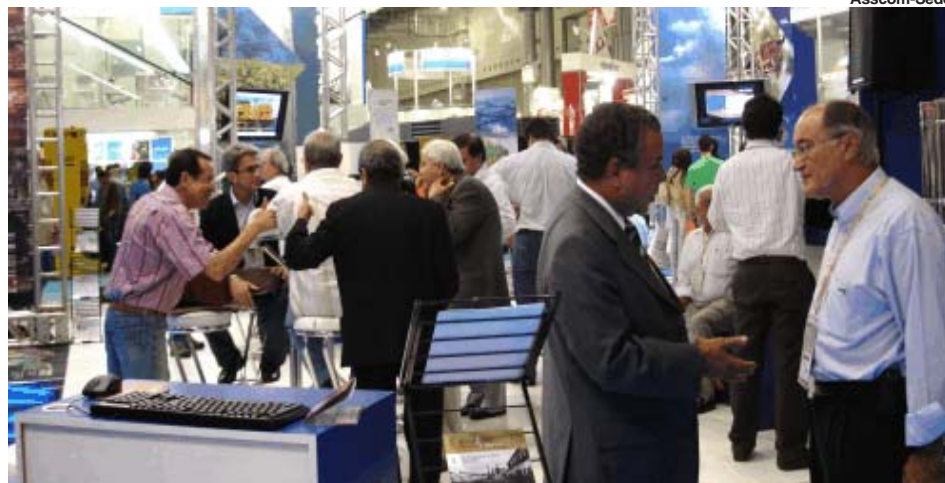
A Exposibram recebeu mais de 35 mil pessoas durante os quatro dias de feira