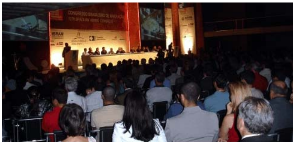
Solenidade de abertura do 12º Congresso Brasileiro de Mineração