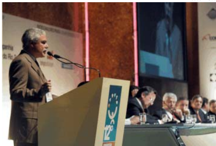
Nelson Hubner discursa na abertura do Congresso

Para tanto, ele lembrou que o Governo Federal vem desenvolvendo a retomada dos levantamentos geológicos básicos, por meio do Serviço Geológico do Brasil (CPRM), e da moderniza-